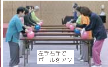
左手右手で ボールをアン

参加されたのは 群馬・愛知・岐 阜・三重・和歌 山・田辺・広島・ 岡山・富田林・ 東三国・西支部 の全 57 名。