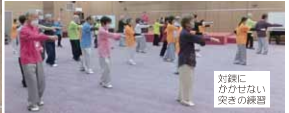
対練に かけない 突きの練習