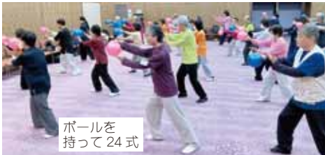
ボールを 持って 24 式

参加されたのは 群馬・愛知・岐 阜・三重・和歌 山・田辺・広島・ 岡山・富田林・ 東三国・西支部 の全 57 名。